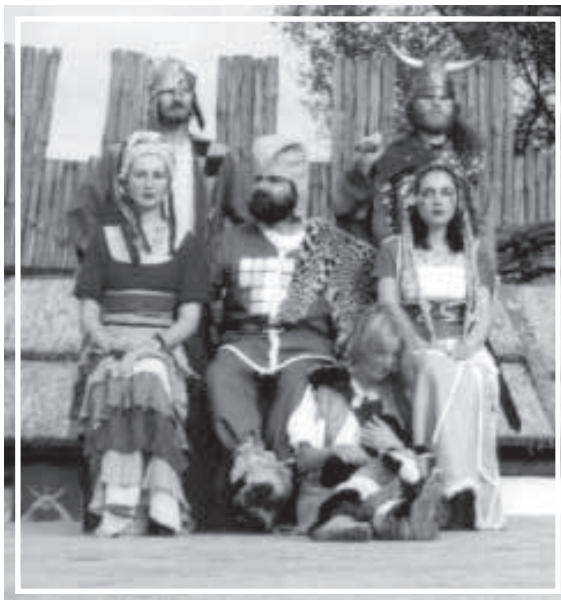
Wódz - oczywiście w centrum.