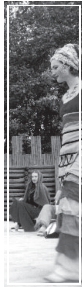
Migawka z pokazu mody.

➔ Namiot "komodo" dwuosobowy, trzykilowy, kopułka, sprzedam za 300 zł. kontakt w redakcji.